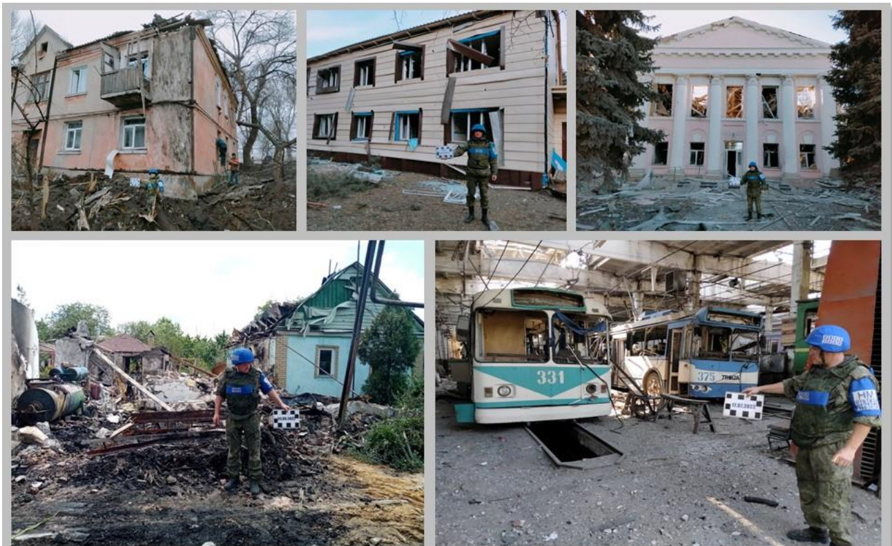
Последствия вооруженной агрессии ВФУ. 1 – г. Стаханов, январь 2023 года, 2 – г. Новоайдар, январь 2023 года, 3- г. Кременная, январь 2023 года, 4 – г. Брянка, июнь 2023 года, 5 – г. Алчевск, июль 2023 года.

Целью вооруженных формирований Украины является максимальное разрушение инфраструктуры республики. Одержимые агрессией украинские войска не считают ни с чем, нанося удары по той территории и объектам, где находится исключительно мирное население: школы, детские сады, больницы, магазины, нарушая при этом все нормы международного гуманитарного права.