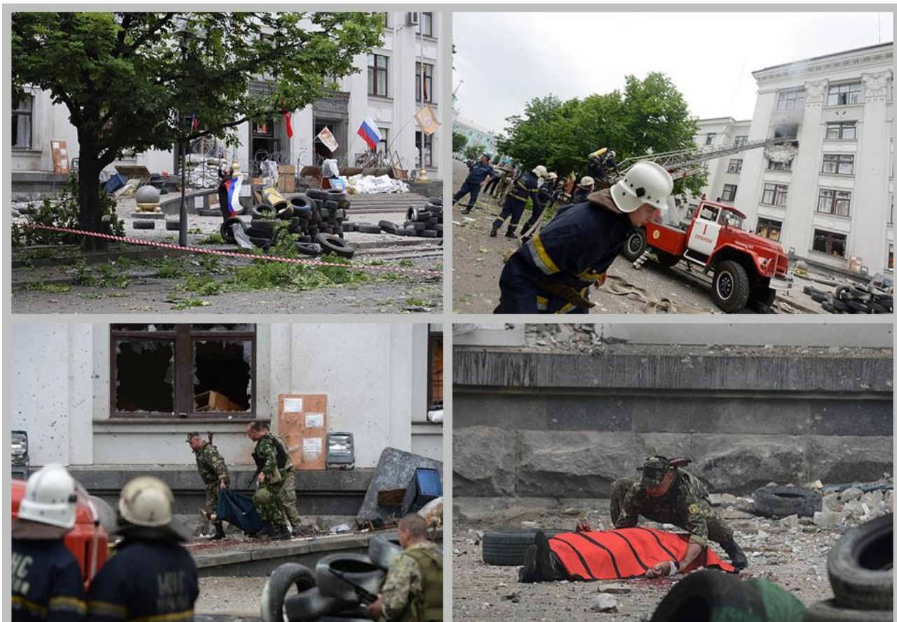
г. Луганск, июнь 2014 года.

в здании находилось Правительство Луганской Народной Республики. Сквер окружали жилые дома, а напротив здания администрации находился детский сад и игровая площадка с детьми.