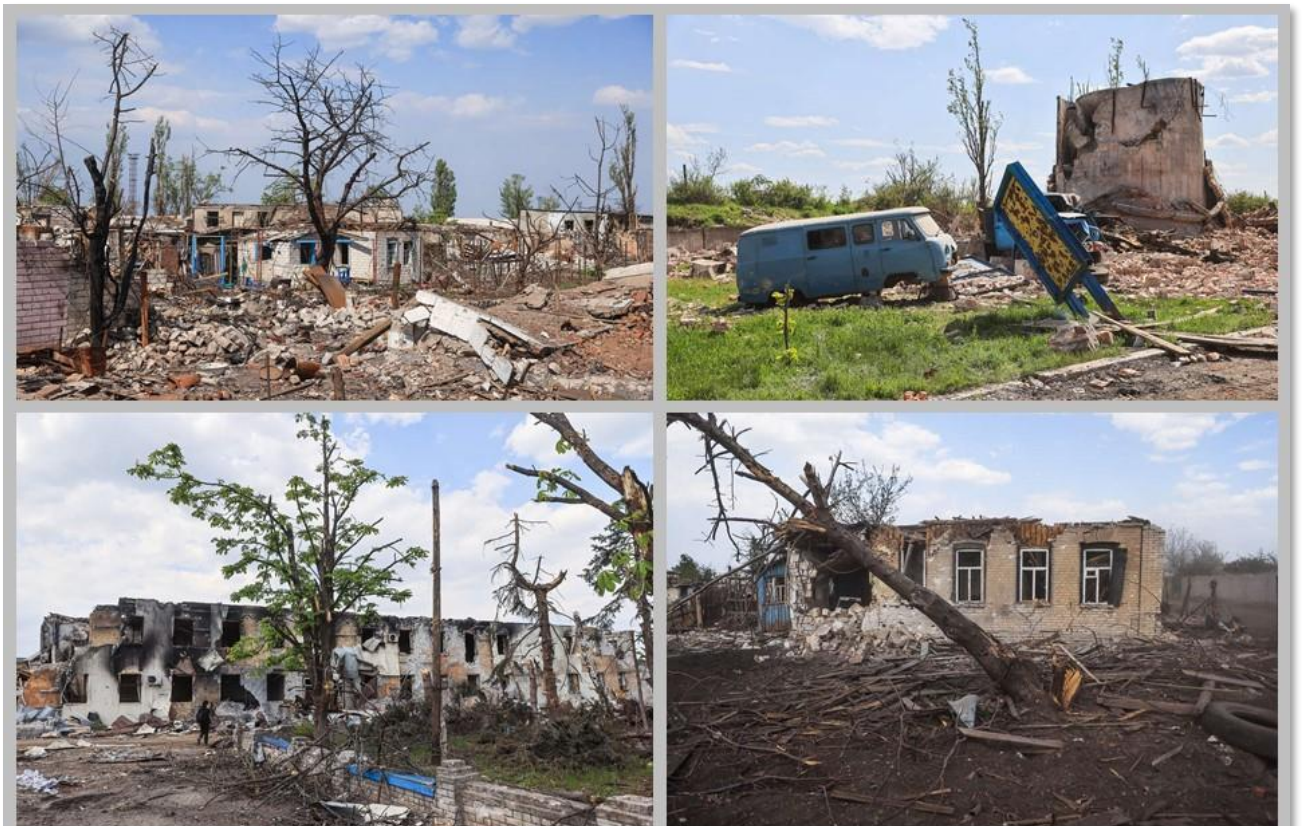
г. Попасная, ЛНР.

Приведенные цифры и факты свидетельствует о всеобъемлющем истребительном характере украинской вооруженной агрессии в отношении гражданского населения Луганской Народной Республики.