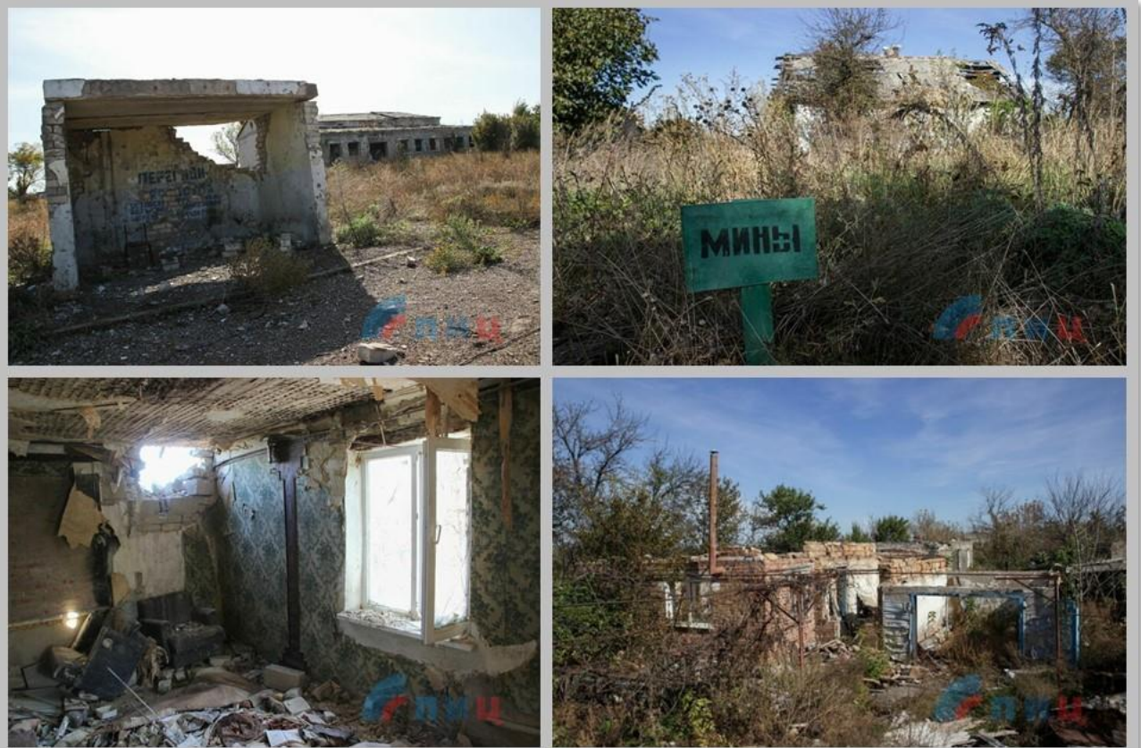
с. Сокольники Славянсербского района, ЛНР.