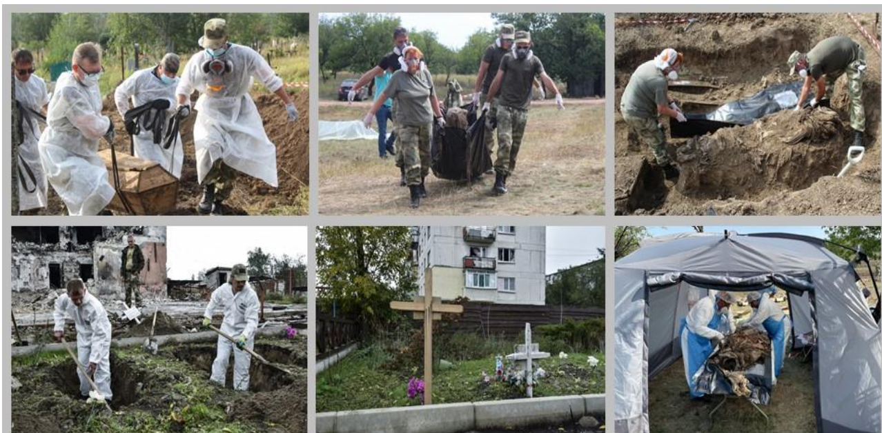
Работа полевой команды Межведомственной рабочей группы по розыску захоронений жертв украинской агрессии, их идентификации и увековечению памяти из мест стихийных захоронений, расположенных на территории ЛНР.

Следует отметить, что фактические цифры жертв среди гражданского населения Луганской Народной Республики за все годы украинской вооруженной агрессии значительно выше, поскольку из мест, подвергающихся регулярным обстрелам украинскими вооруженными формированиями, информация поступает только после фиксации компетентными органами непосредственно на местах, а учитывается – после проведения соответствующих процессуальных проверок.