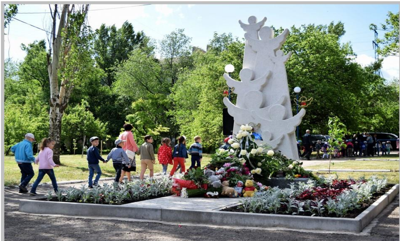
Мемориальный комплекс «Аллея ангелов», г. Луганск.

27 июня 2017 года в парке имени Щорса города Луганска состоялась церемония открытия памятного знака погибшим детям Луганской Народной Республики, самому младшему из которых было 24 дня.