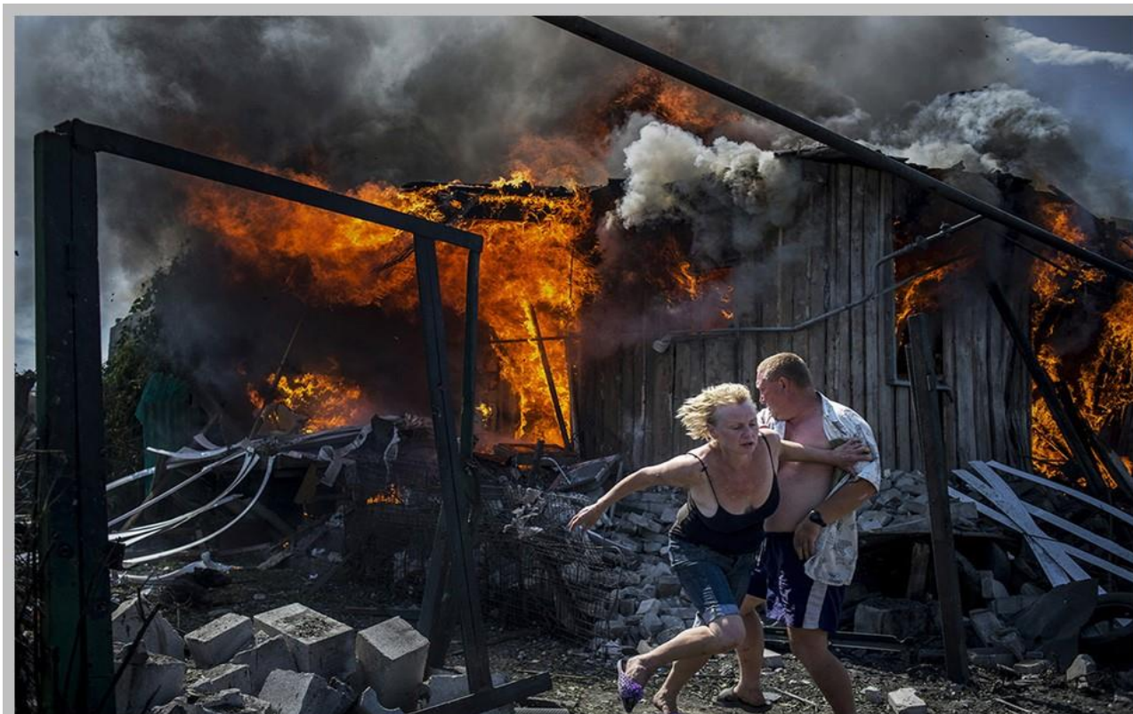
Последствия авиационного удара ВСУ по станции Луганская. Июль 2014 года.

Право на жизнь занимает особое место в правовом государстве. Будучи по своей природе фундаментальным, оно базируется на конституционных нормах и принципах, устанавливающих общие стандарты повсеместного признания и единообразного применения, а также механизмы по обеспечению и защите права на жизнь.