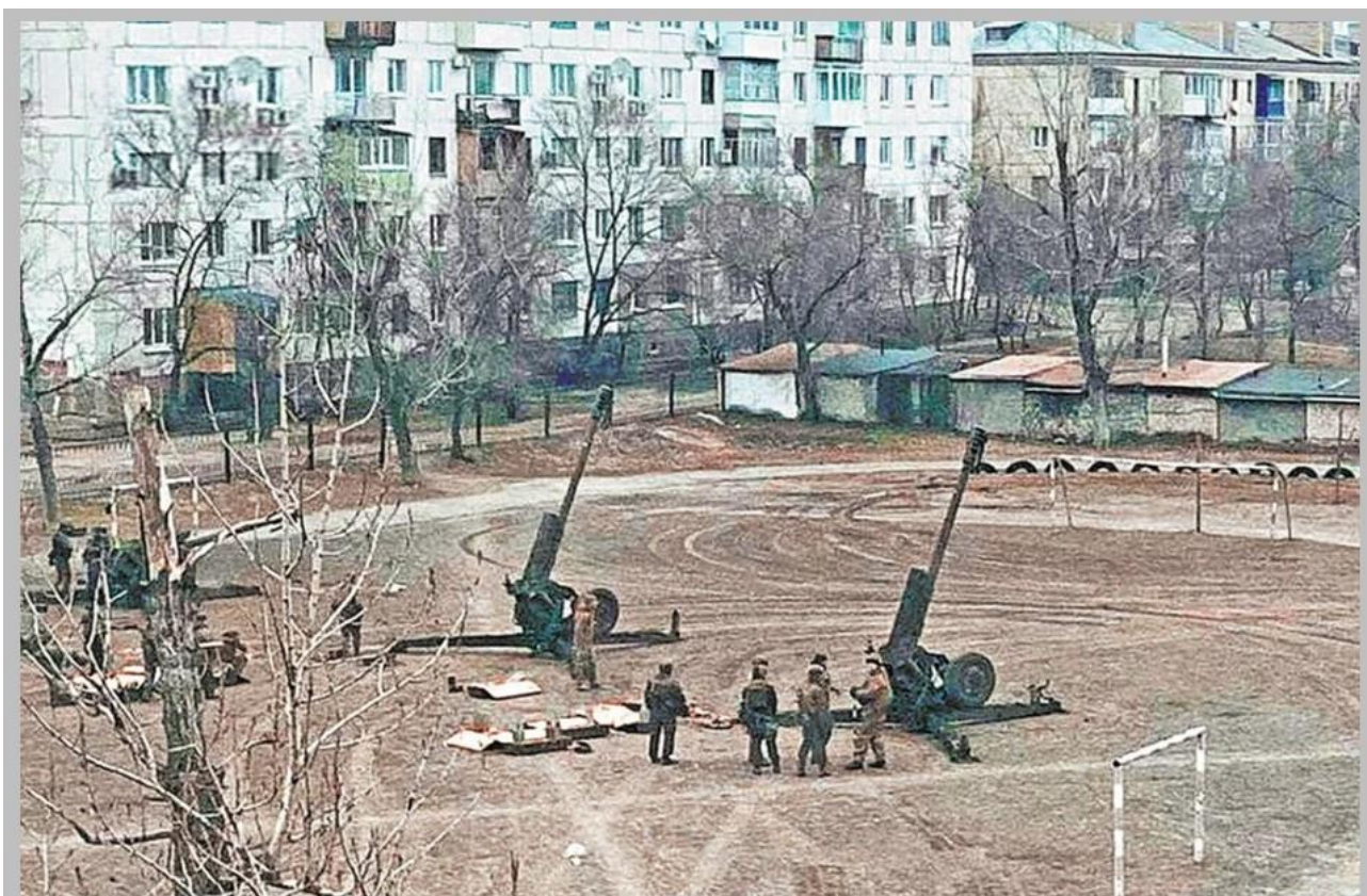
Техника ВСУ во дворах жилых домов. г. Северодонецк.

Отголоски этой войны еще долго будут преследовать нас, поскольку украинские боевики при отступлении с особым усердием и злобой минируют уже не подконтрольную им территорию.