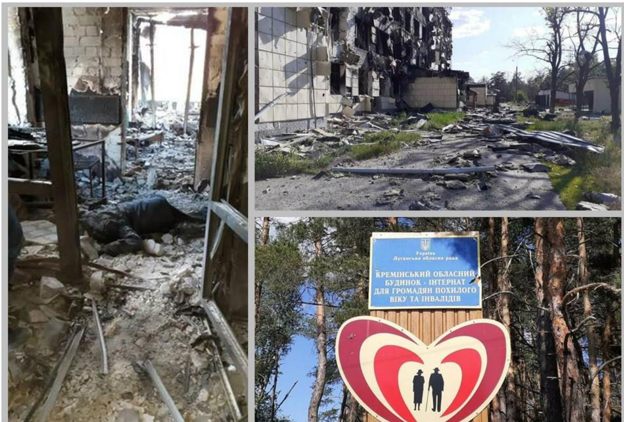
Кременской дом-интернат для граждан пожилого возраста и инвалидов.

По данному факту Следственным комитетом Российской Федерации возбуждено уголовное дело. Всех виновных ждет заслуженное наказание.