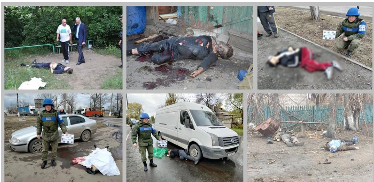
Жертвы вооруженной агрессии Украины.

В период проведения войны в Донбассе, именно войны, а не антитеррористической операции, самые страшные потери – это невозвратные человеческие жизни.